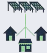
Energía solar comunitaria tradicional (TCS)