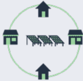
Energía solar comunitaria de iniciativa comunitaria (CICS)